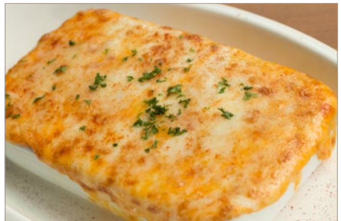
LASAGNA VERDI AL FORNO 455

Spinach lasagna with minced beef sauce and parmesan cheese