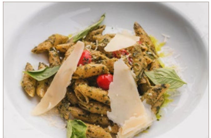
PESTO SAUCE 375

ครีมซอส แฮม เบคอน เส้น : สเปากิตตี้ / เพนเน่ / เฟลตตูชินี่ / ริกาโตนี่