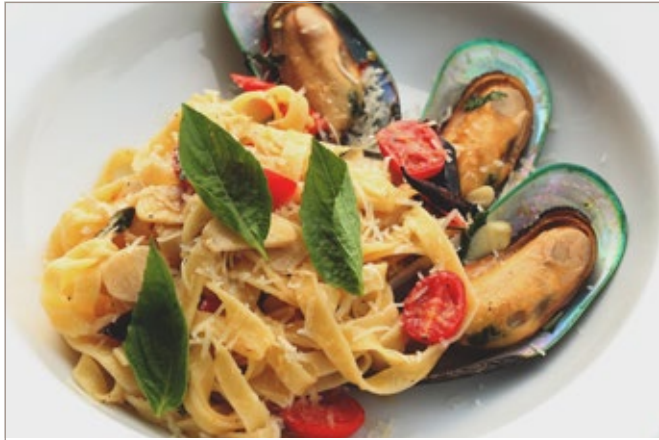
AGLIO E OLIO WITH MUSSEL 425

New Zealand mussel with choice of your pasta: spaghetti / penne / fettuccini / rigatoni