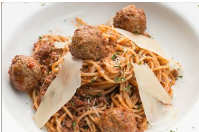
BOLOGNAISE MEATBALL 425 +90

ซอสโรหะพากับพาร์เมซานชีส เส้น : สเปากิตตี้ / เพนเน่ / เฟลตตูชินี่ / ริกาโตนี่