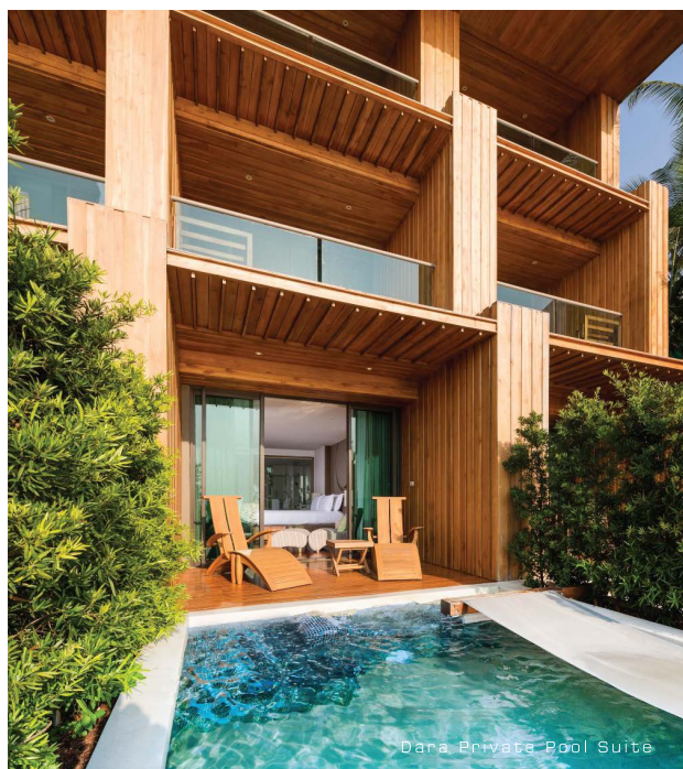
Dara Private Pool Suite