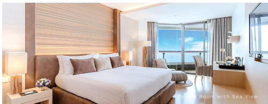
Deluxe Room with Sea View